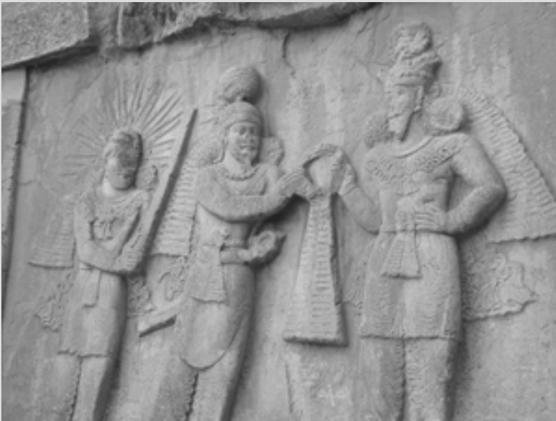
نقش برجسته اهورامزدا و اردشیر دوم ساسانی در طاق بستان

در سمت راست ایوان کوچک طاق بستان، یک سنگ نگاره از اهورامزدا و اردشیر دوم (۳۷۹-۳۸۳ م) نهمین شاه ساسانی وجود دارد. اردشیر با دست راست در حال گرفتن دیهیم شاهی از اهورا مزداست.