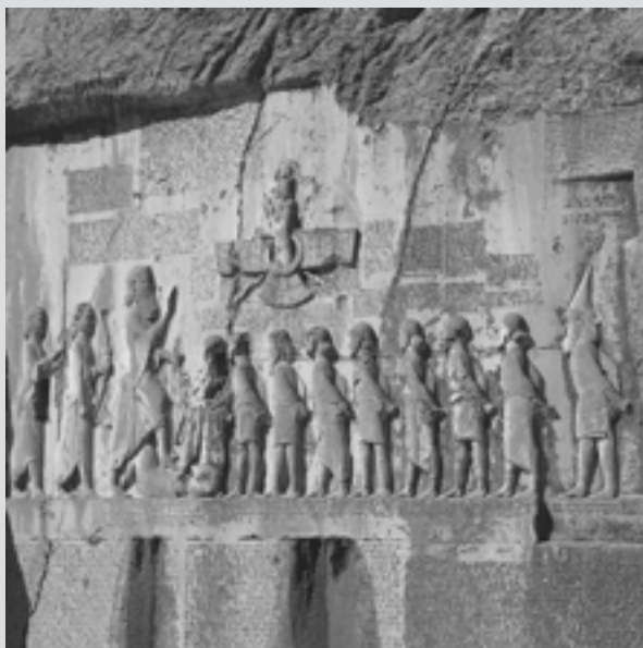
تصویر سنگ نگاره داریوش در بیستون

در سمت چپ نقش برجسته تصویر تمام قد داریوش قرار دارد و دوتن از یاران او پشت سرش ایستاده‌اند. در روبه‌روی او نه تن از سران شورش به بند کشیده به چشم می‌خورند که در جلوی آنها گنومات مغ به پشت خوابیده و پای چپ داریوش بر سینه او نهاده شده است. درست بالای سرشورشیان، نگاره فروهر (نماد اهورامزدا) حک شده است که حلقه‌ای را در دست چپ دارد و به سوی داریوش دراز کرده است. این امر نشان اعطای پادشاهی توسط اهورامزدا به داریوش است.