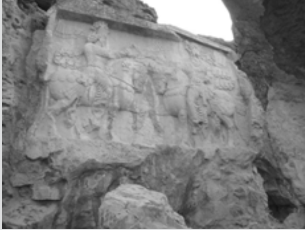
نقش برجسته اهورامزدا و شاپور اول ساسانی در نقش رجب