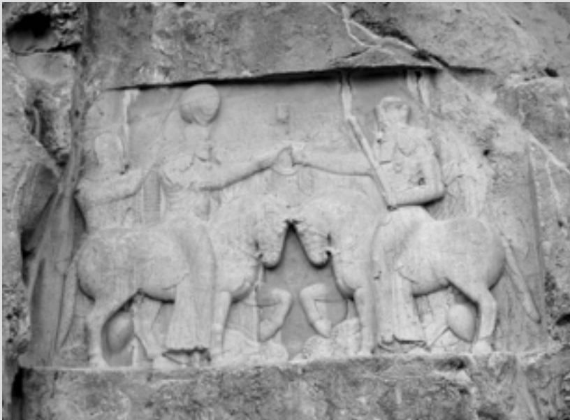
تصویر نقش برجسته اهورا مزدا و اردشیر بابکان در نقش رستم

این سنگ نگاره یکی از سالم‌ترین سنگ نگاره‌های متعلق به دوره ساسانی است. پیکره‌های اردشیر (سمت چپ) و اهورامزدا سوار بر اسب کند و کاری شده‌اند. در زیر پای اسبان، پیکره‌های بر زمین افتاده دشمنان اهورامزدا و شاه یعنی اهریمن و اردوان پنجم اشکانی تصویر شده‌اند. اهورامزدا دست راستش را به سوی اردشیر دراز کرده و دیهیم یا حلقه‌ای از گل را که نماد فره ایزدی است، به او اهدا می‌کند و در دست چپ او برسم ۱ دارد. نقش برجسته‌های دیگری از اهورامزدا و اردشیر با مضمونی شبیه به این. در نقش رجب و فیروز آباد فارس نیز وجود دارد.